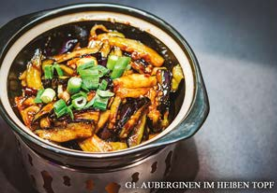
110. AUBERGINEN IM HEISSEN TOPF