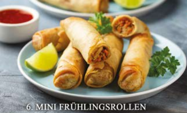
6. MINI FRÜHLINGSROLLEN