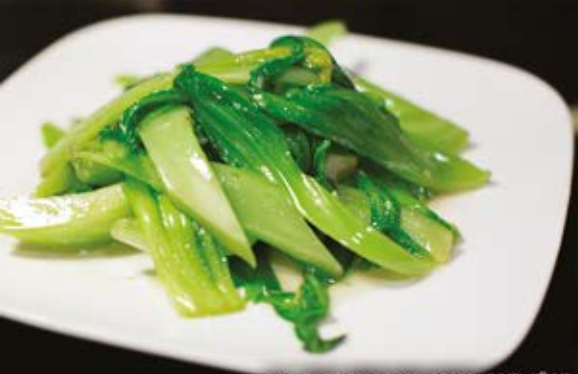
116. PAK CHOI SHANGHAIGEMÜSE