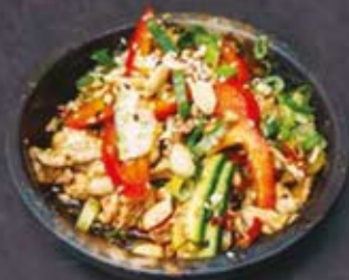
17. HÄHNCHEN SALAT