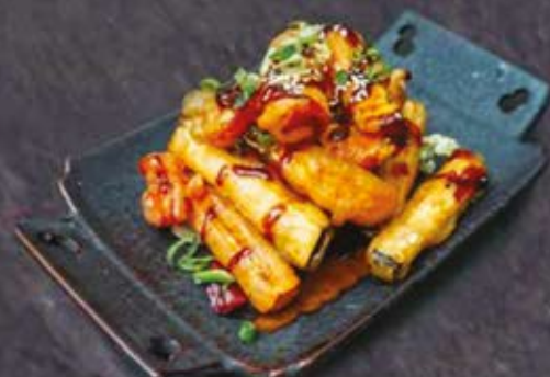
8. SÜBKARTOFFELN MIT GEMÜSE